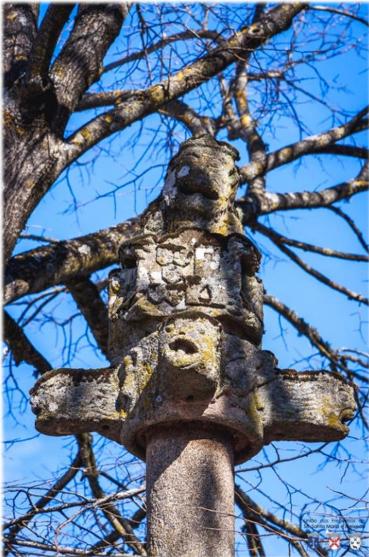
Figuras 3: Pormenor do capitel, UFSSMM, 2018.

Este monumento é constituído por um soco octogonal, com quatro degraus, onde assenta a escultura zoomórfica com aproximadamente 2 m de comprimento. Do dorso do animal irrompe uma coluna cilíndrica lisa, com cerca de 6,4 m de altura, coroada por uma espécie de capitel.