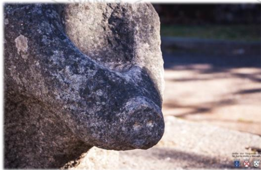
Figura 2: Pormenor da cabeça da “Porca da Vila”, UFSSMM, 2018.

Classificado como Monumento Nacional por Dec. Lei de 16-6-1910, o Pelourinho de Bragança situa-se na Praça de São Tiago, também conhecida pelos populares, como “Jardim da Porca”, mesmo ao lado da Torre de Menagem do Castelo de Bragança.